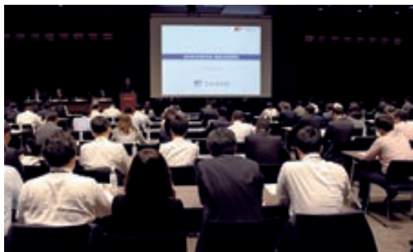
決算説明会の模様①

正確かつ公平に情報を開示することを基本方針とするディスクロージャーポリシーを掲載するほか、関係法令等に基づく情報開示に加え、財務・非財務情報について積極的に情報発信を行っています。