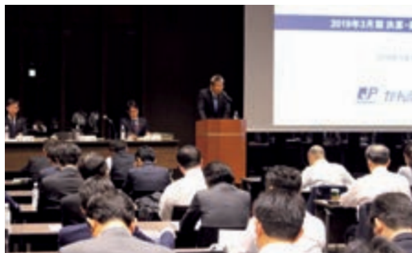
決算説明会の模様②