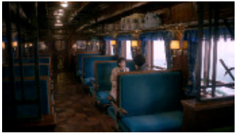
(能年さん) 「視界がきつと開けるから。」