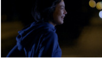
(能年さん) 「そしたら、」