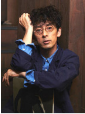
滝藤 賢一（たきとう けんいち）さん