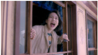
(滝藤さん) 「日本中を歩きなさい。」