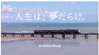
(滝藤さん) 「人生は、夢だらけさ。」 (タイトル) 人生は、夢だらけ。