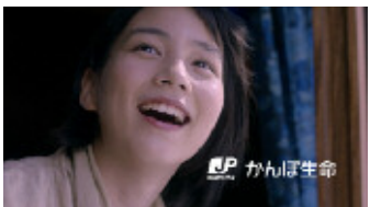
(能年さん) 「かんぼ生命」 (ロゴ) かんぼ生命