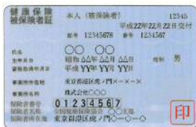
(例) 各種健康保険証