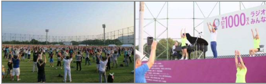
「第 57 回 1000 万人ラジオ体操・みんなの体操祭」の様子(2018 年 8 月 5 日岡山県倉敷市)

巡回ラジオ体操・みんなの体操会と同時に開催地を募集しておりますので、ご希望の自治体さまは、かんぽ生命Webサイトに掲載している申込方法をご確認の上、お申し込みください。