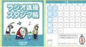
表紙デザイン カレンダー(1月)デザイン 印影イメージ